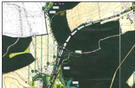
F-Plan – Bestand