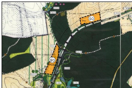
F-Plan – 3. Änderung